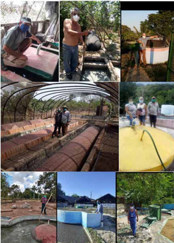
Fig. 2. Usuarios del MUB exhibiendo sus diferentes diseños de biodigestores que mantienen activo su funcionamiento.