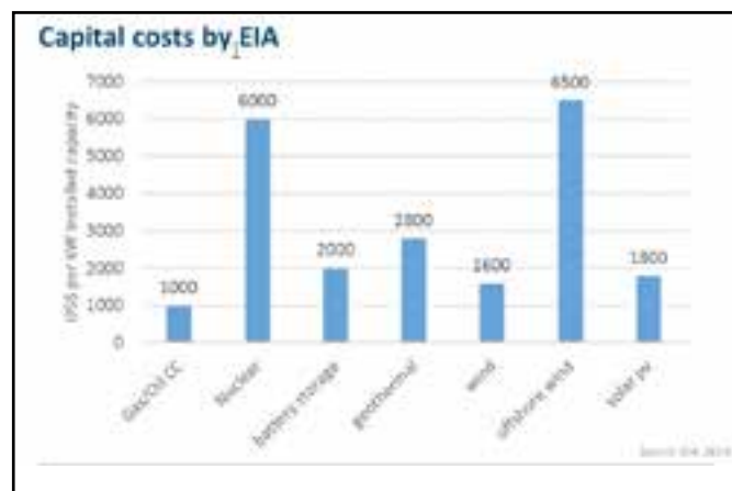
Fig. 1. Costo capital de las energías.

Para el caso de la energía eólica y teniendo en cuenta el desglose de los gastos de inversión, como se muestra en la figura 2.