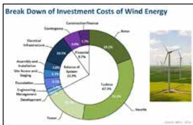
Fig. 2. Desglose de los costos de inversiones en la energía eólica.

Para el caso de la energía eólica y teniendo en cuenta el desglose de los gastos de inversión, como se muestra en la figura 2.