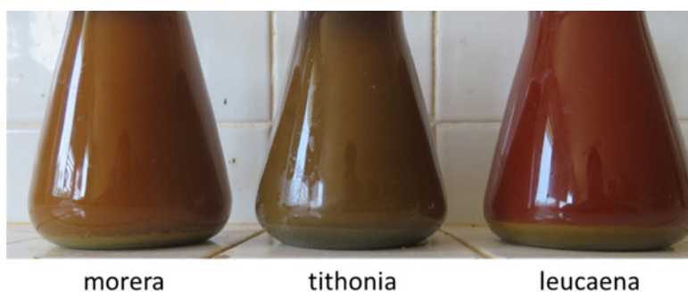
Fig. 1. Imágenes de los SLNC de las tres plantas forrajeras proteicas en estudio después de 24 h en reposo.

Los grupos de cerdos del experimento comenzaron el estudio con un peso promedio inferior al que teóricamente debía tener con esos días de vida (Figura 2). De manera general, los cerdos que consumieron los SLNC mostraron mejor tendencia en la evolución del peso promedio con respecto al grupo control (Figura 2).