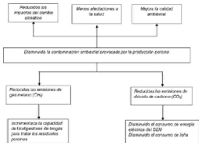
Fig. 2. Árbol de Objetivos.

En un quinto momento se efectuó el análisis cualitativo y cuantitativo de las alternativas de solución. En este contexto las alternativas de intervención evaluadas fueron las siguientes: