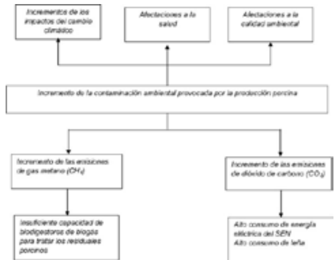
Fig. 1. Árbol de Problemas.

Se validó que el desarrollo y utilización del biogás como fuente renovable de energía, además de constituir un valioso recurso energético, contribuye a la reducción de la contaminación ambiental y a la mitigación del cambio climático.