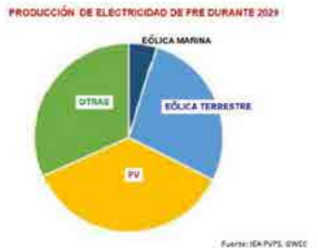
Fig. 2. Producción de electricidad de FRE durante 2019.

En términos de energía, debido a la diferencia por el factor de planta, la participación de generación eléctrica por fuente añadida durante 2019, sin hidroenergía, fue de (Fig. 2):