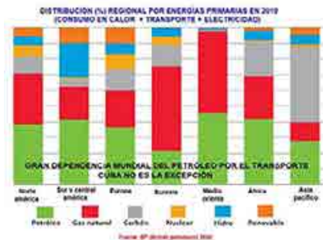
Fig. 3. Distribución porcentual regional por tipos de energía primaria en 2019.

La energía primaria se refiere a todos los tipos de consumos energéticos, como: calor, electricidad y transporte, cuyas matrices energéticas se muestran a continuación (Fig. 3).