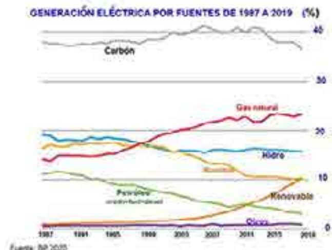
Fig. 5. Generación mundial eléctrica por fuentes (1987-2019).

El propósito de estas comparaciones es demostrar la enorme dependencia de Cuba del petróleo para su generación eléctrica. Nótese que se parece más a la matriz de los países grandes productores de petróleo y gas natural del Medio Oriente, solo que inclusive utilizamos más petróleo y menos gas natural que ellos. Esta es una de las causas del encarecimiento de la generación eléctrica en Cuba (Fig. 5).