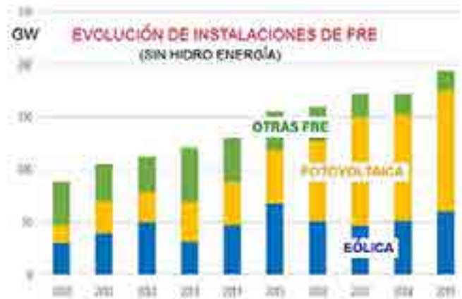
Fig. 1. Evolución de instalaciones de FRE (sin hidroenergía).

La hidroenergía ha sido y es la FRE con más generación de energía eléctrica, seguida por la eólica, mientras que la FV se ha continuado incrementando, tal como se muestra en la Fig. 1 de instalaciones anuales en términos de potencia: