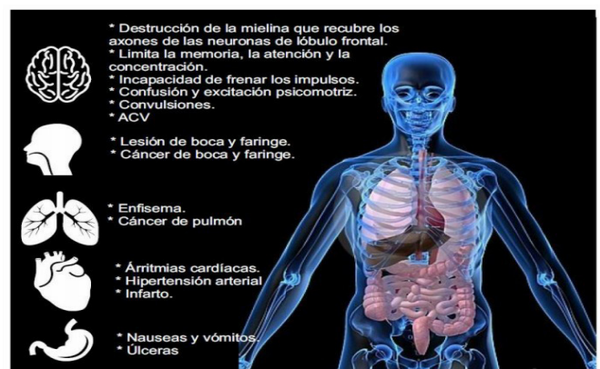
Fig. 2 . Daños biológicos.

La reproducción también se afecta (Fig. 2), porque para que en los ovarios se produzcan óvulos y hormonas, en los folículos se secreten estrógenos y progesteronas y contribuyan al desarrollo y la función de los órganos sexuales. Se necesita del descanso, la alimentación adecuada y la atención médica para lograr un embarazo a término, así como un parto fisiológico normal. Cuando estas condiciones no existen, se produce el bajo peso del recién nacido, el embarazo precoz, retraso mental, un deficiente desarrollo y malformaciones congénitas, aumento de la mortalidad infantil y de la madre [EcuRed 2019; Portela Falguerras R. J. et al. , 2000; Malacalza L., 2003].