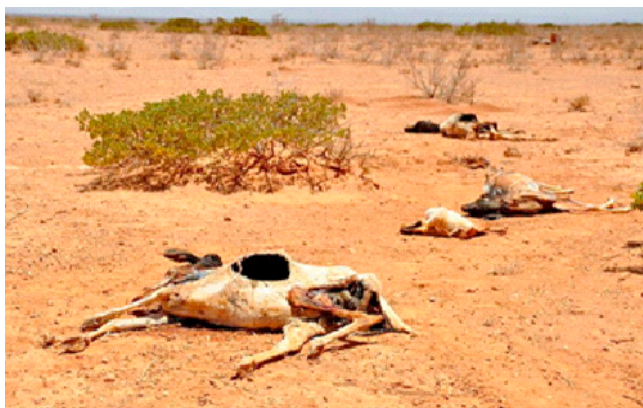
Fig. 3. Mortalidad de la fauna silvestre.

Destrucción del hábitat natural: A la fauna silvestre le origina mortalidad (Fig. 3), modificación de su hábitat natural, escasez de alimentos, pérdida de sus refugios y migración de las especies, cambio de las condiciones de las estaciones anuales trastornando y perjudicando las cosechas y la reproducción, porque en muchos animales hay una estación del año definida de apareamiento, en la que existe un aumento evidente del tamaño de los testículos, que se corresponde con la espermatogénesis en los machos; en la mayoría de las hembras de los mamíferos la receptividad para el apareamiento solo es eficaz en cortos periodos de celo a lo largo del año, y se caracteriza por un aumento del impulso sexual y por cambios en los ovarios, el útero y la vagina.