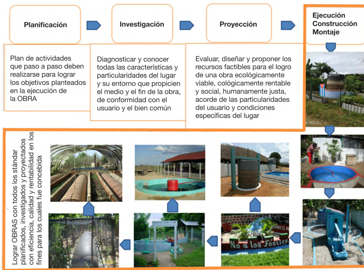
Fig. 2. Eslabones principales para el uso del biogás con inclusión social.

La evaluación económica de la utilización de la tecnología del biogás presenta características propias que hacen complejo su análisis pues no sólo interviene en este caso el aspecto energético sino que también existe un importante impacto de difícil evaluación en cuanto a la sanidad, fertilización, mejoramiento de suelos, alimentación de animales y mejoramiento de las condiciones de vida. Por ello, en el contexto del MUB la evaluación de acciones que involucran al biogás ha estado presidida de un análisis particular e integral en base a los sistemas de tratamiento a ciclo cerrado. No obstante a ello, y para ser consecuentes con un enfoque metodológico correcto que permita el análisis de un proceso de gestión, evaluación y uso de la de la tecnología del biogás con inclusión social, se ilustra en la figura 2 una cadena con los elementos principales a considerar.