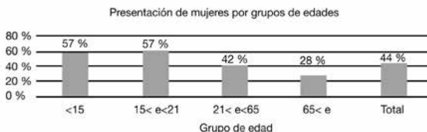
Fig. 1. Población de la comunidad (año 2020).