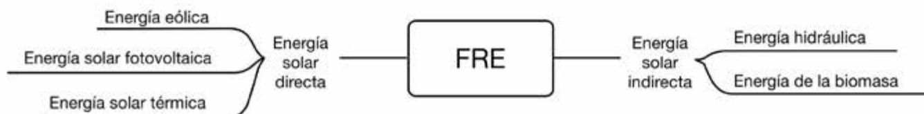
Fig. 1. Potencial del empleo de las FRES en la comunidad objeto de estudio.